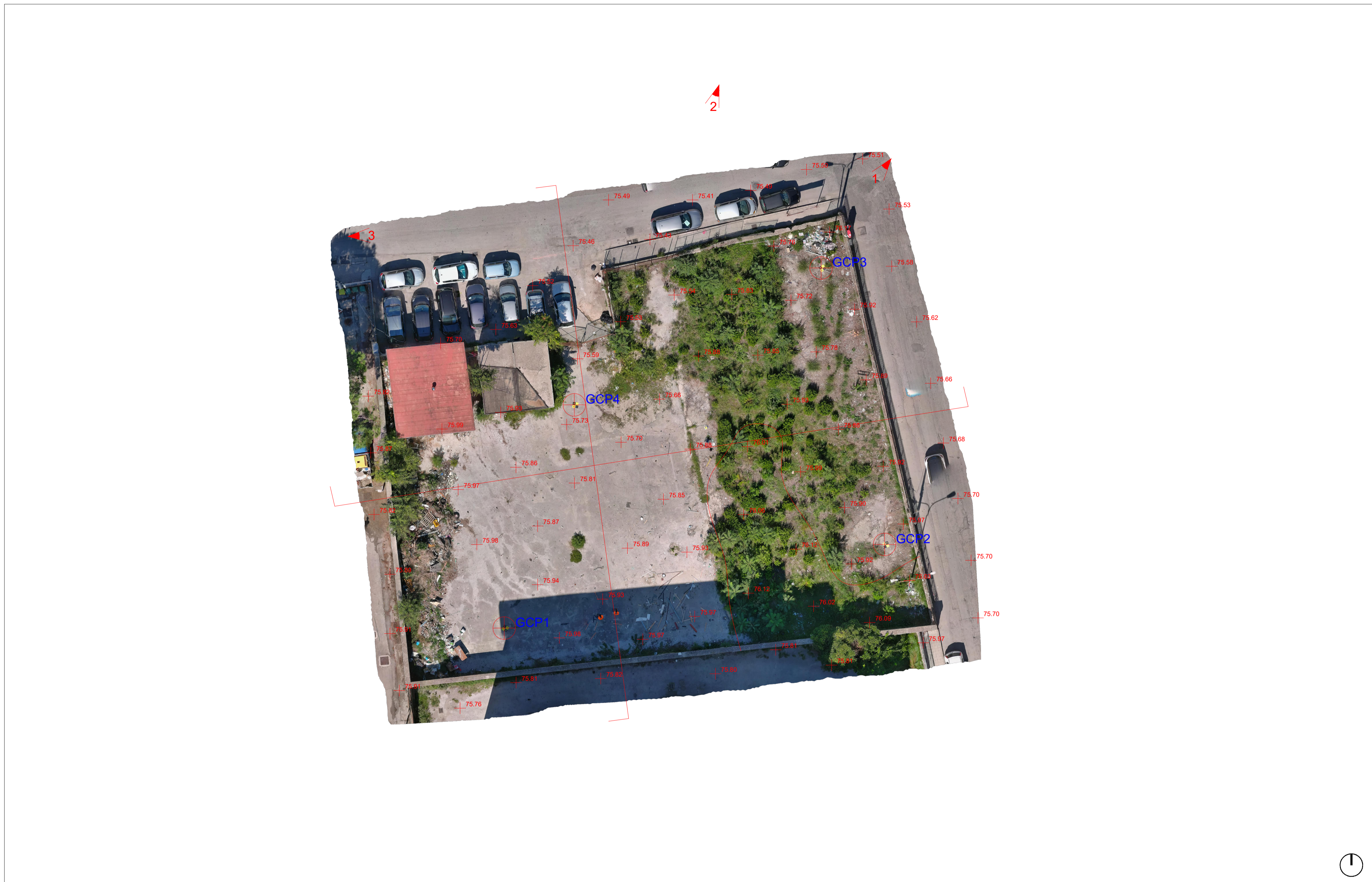
Ortofoto- stato di fatto - scala 1:200